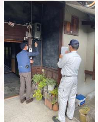
電気ガス設備の無料点検