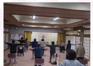
山吹体操クラブ（転倒予防）