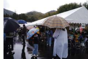
ふれあい福祉まつり模擬店