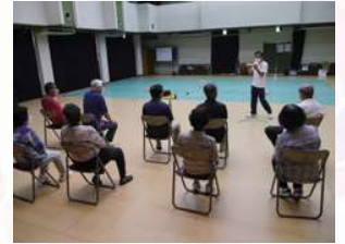
介護予防運動リーダー研修会