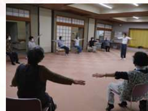
生き生き体操教室