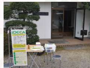
IDECA 公民館出張受付窓口