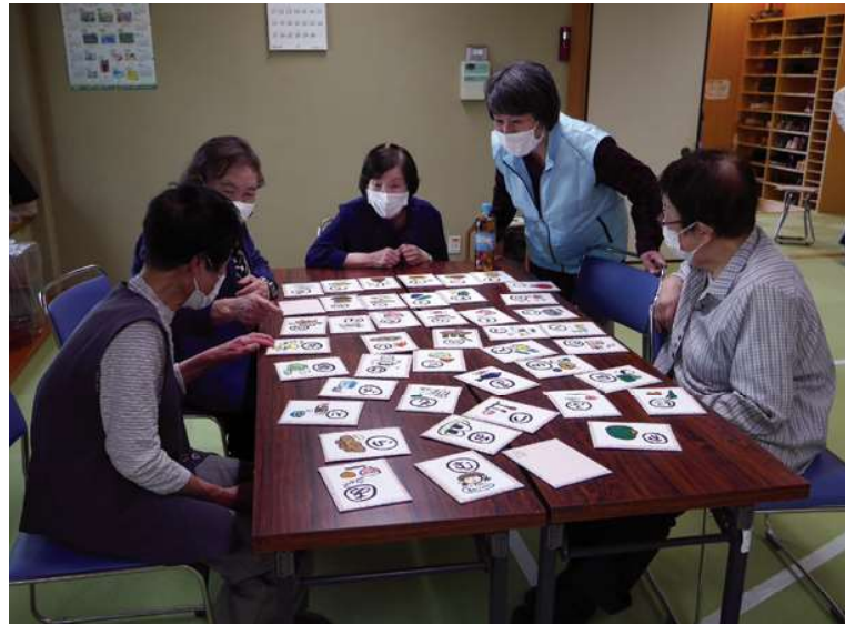
地域福祉推進員さんによる「ミニサロン」一部再開