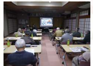
地域福祉活動研修会