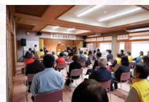
ふれあい福祉まつり式典