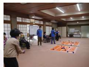
生き生きサロン（ベタピンゴ）