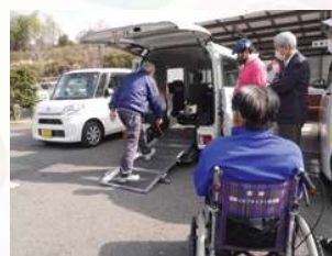
福祉移動サービス