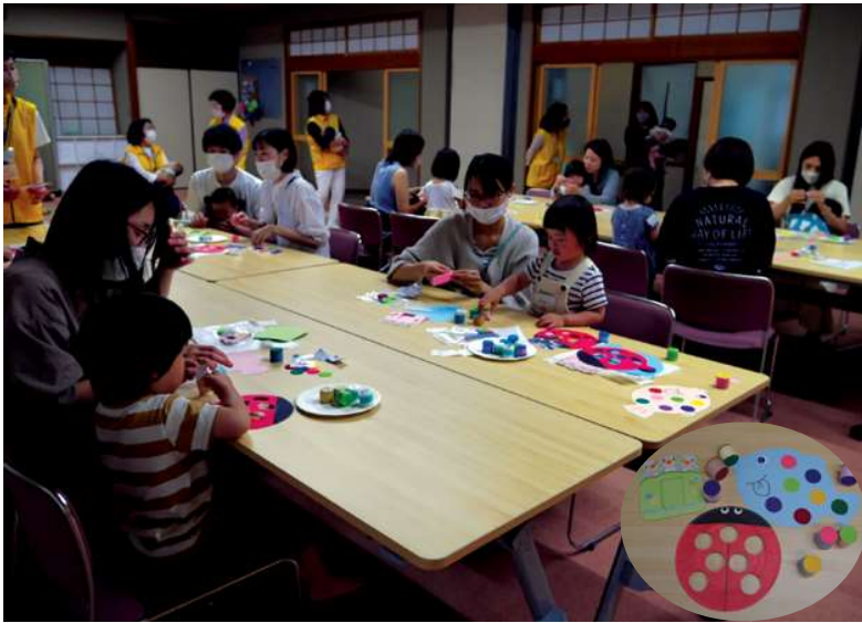
3年半ぶりに再開した屋内での「子育てサロン」