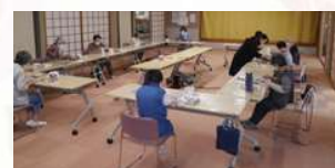
生き生きサロン（工作）