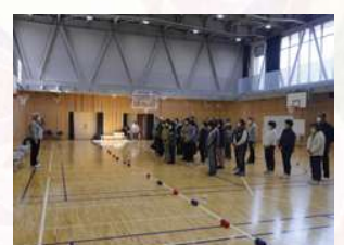
地域福祉推進員研修・交流会