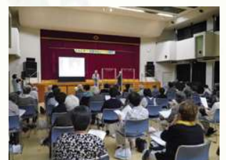
合同サロン（演芸会）