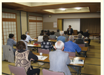
フレンドリーサポート事業協力会員養成講座