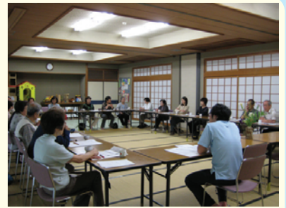
ボランティアグループ定例会