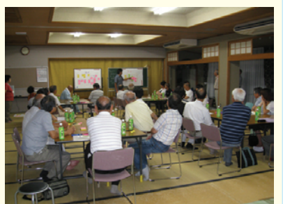
地区別住民ワークショップ