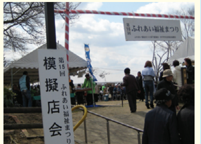
第15回ふれあい福祉まつり