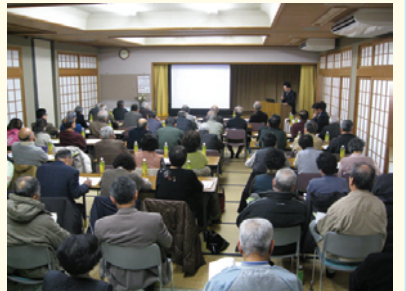
災害ボランティア講座