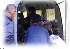
福祉移動サービス(研修会の様子)