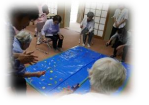
社協♥生き生きサロン