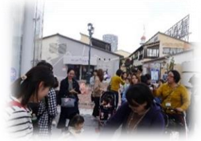
子育て支援(バス遠足)