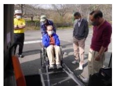
協力会員研修会のようす

活動を詳しく知りたい方、ご協力をいただける方は、井手町社会福祉協議会までご連絡ください。 (☎0774-82-3901)