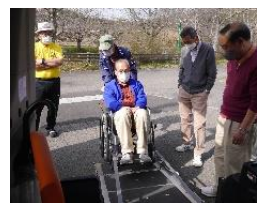
協力会員研修会のようす