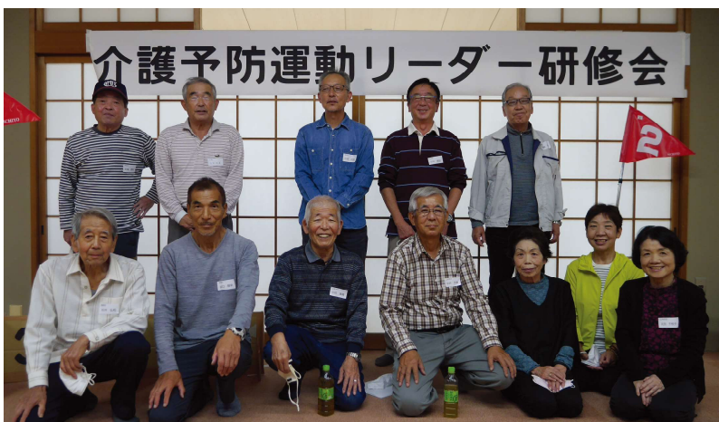
10/11 介護予防運動リーダー研修会（グラボル）