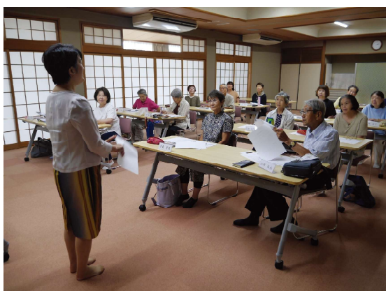
9/19 朗読ボランティア養成講座を開催しました。参加16名。