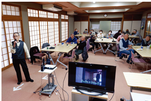
8月から始まった「Happyカラオケサロン」好評です！男性の参加も多くなっています。毎月第4火曜日午後1時30分より、玉泉苑にて開催しています。参加費200円、申込不要です。お気軽にご参加ください。