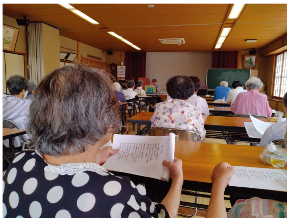
各地区で地域福祉推進員さんによるミニサロンが再開され始めました！