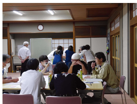
7/18.25.27 各地区の代表者に集まっていたいただき、地区をより良くするための話し合いをしていただきました。