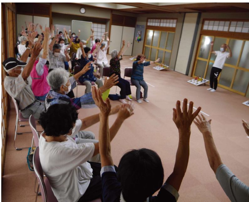
生き生きサロン（毎月第3金曜日）