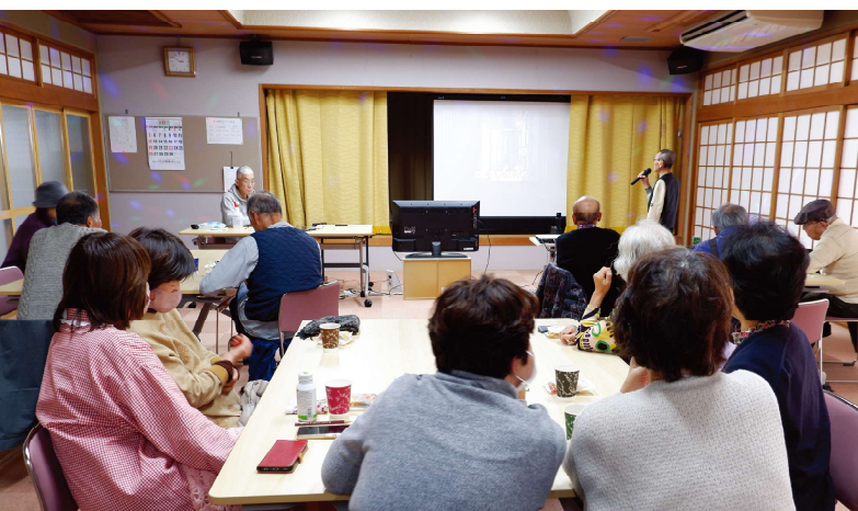
Happy カラオケサロン（毎月第4火曜日）