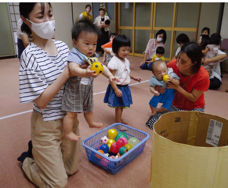
9/8 子育てサロン～ミニミニ運動会～