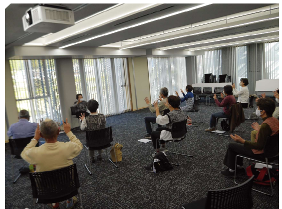
9/22.10/11.30 介護予防運動リーダー研修会（全3回）で、カーリンコン、グラゴル、音楽体操をご紹介しました。