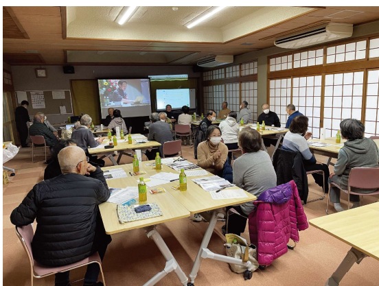
11/25 きょうと地域福祉活動実践交流会では、京都府下で日々活動されている500名以上の活動者とオンラインでつながることができました。