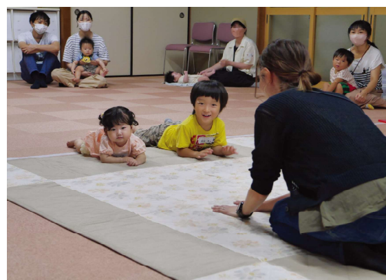
9/8 4年ぶりに子育てサロン～ミニミニ運動会～を開催しました。