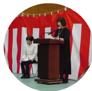
司会 朗読サークルふれあい