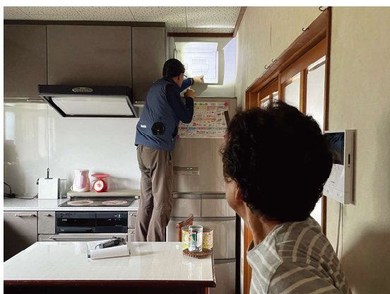
8/18 町内の業者・消防署の方々のご協力を得て、高齢者16世帯の電気・ガス設備点検を実施しました