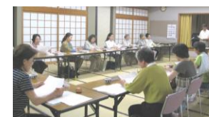
昨年の講座の様子

☆今年の講座(全4回)は“正しい発声とイメージ豊かに読む”を目標に、第1回目は、7月27日(水)13:30から15:30まで、老人福祉センター玉泉苑にて開催します。☆お問い合わせ・お申込みは、井手町社会福祉協議会(☎82-3499)まで。