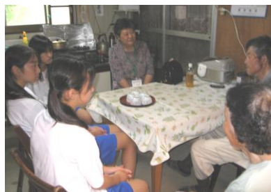
社会福祉体験学習「傾聴ボランティア体験」の様子