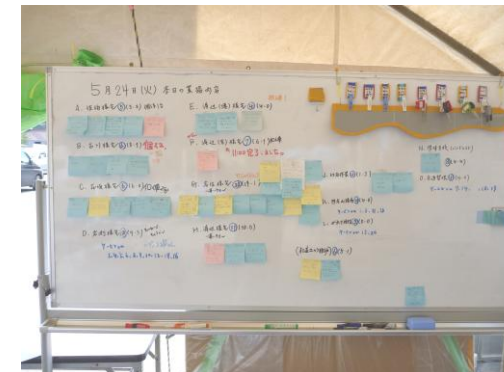
被災者の困りごと（ニーズ） の把握・受付