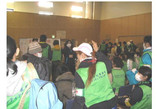
被災者の困りごと（ニーズ） とボランティアのマッチング