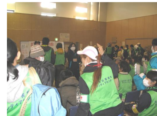
被災者の困りごと（ニーズ） とボランティアのマッチング