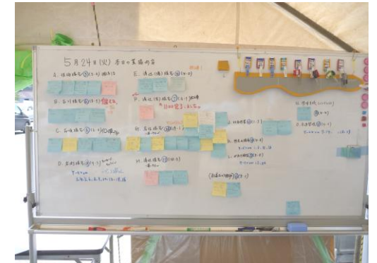
被災者の困りごと（ニーズ） の把握・受付