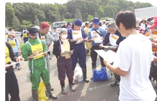
ボランティア活動出発前の説明 (オリエンテーション)