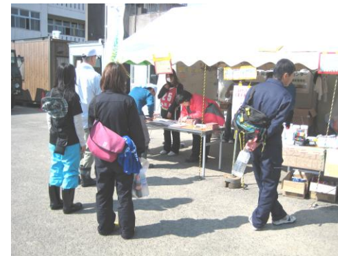
全国から駆けつける ボランティアの受付