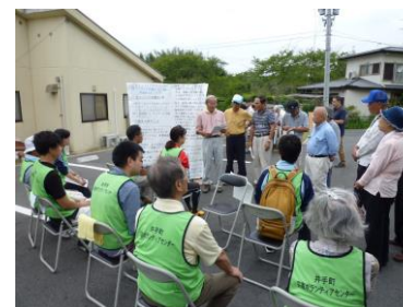
ボランティアの心得など 活動場所に出発前の説明 (オリエンテーション)