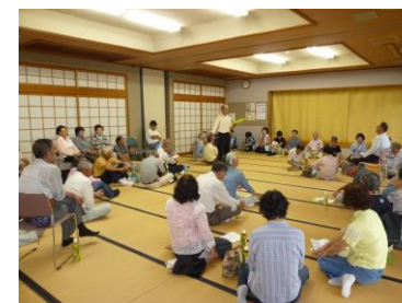
訓練終了後、反省や今後の 課題を出し合いました。