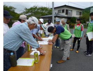
全国から駆けつける ボランティアの受付