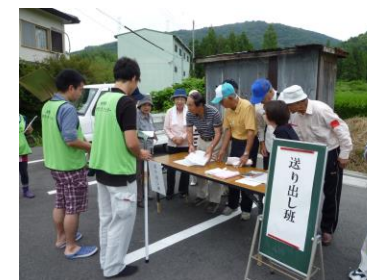
ボランティアを活動場所まで道案内 (送り出し班)