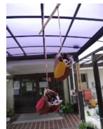
＜工作＞ みのむしの モバイル