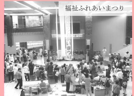
福祉ふれあいまつり