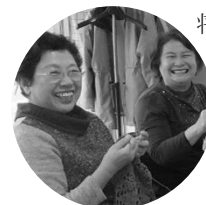
【陽寿苑】 編み物サークル