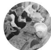
【陽和苑】 将棋サークル