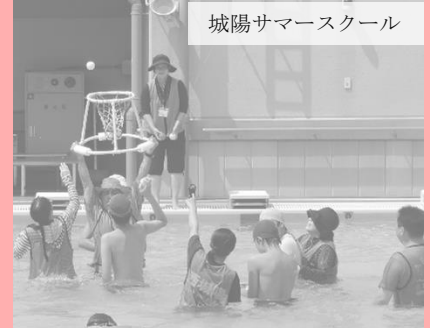
城陽サマースクール