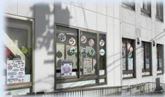
ボランティアフェスティバル ポスター展示会