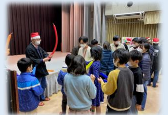
城陽サマースクール