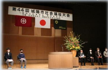
第44回城陽市社会福祉大会