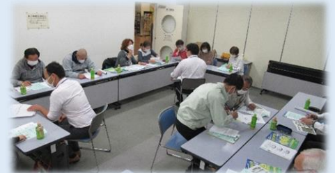
地域福祉活動計画ヒアリング(寺田校区社会福祉協議会)

・地域にある福祉課題の把握やみんなで支えあう活動づくりに向け、アンケートや懇談会を通して共有しています。