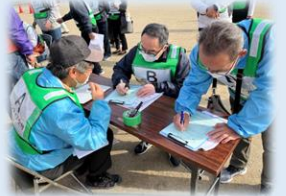
京都市立木津川運動公園での訓練