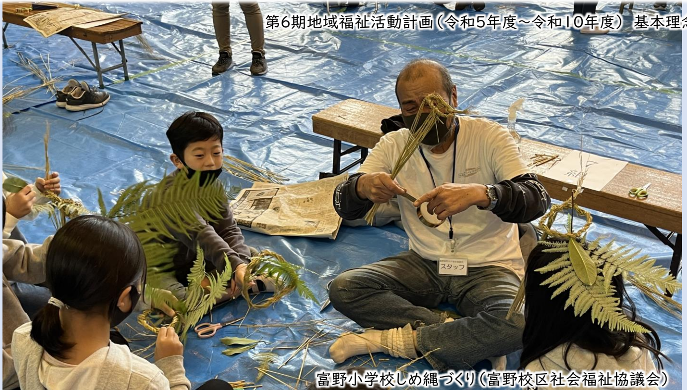
第6期地域福祉活動計画(令和5年度~令和10年度) 基本理念