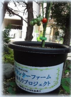
プランターファームみまもりプロジェクト(今池校区社会福祉協議会)