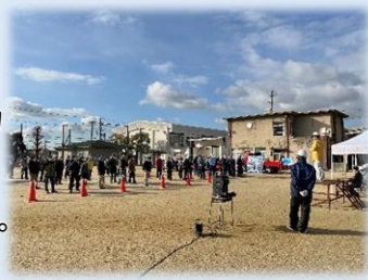
防災訓練(青谷校区社会福祉協議会)

・声をかけあい、ひとりでも安心して暮らせる地域になるようにと、民生児童委員や自治会等と協力して見守り活動等に取り組んでいます。