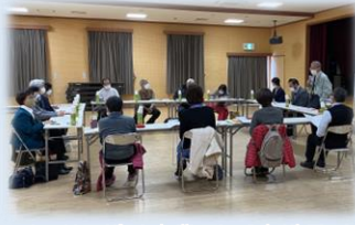
福祉サービス利用援助事業 生活支援員研修会