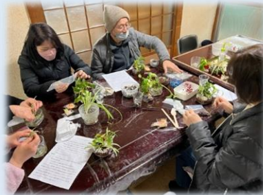
校区社協サロン(久津川校区社会福祉協議会)

・地域での居場所づくりや仲間づくりを目的に、交流を通して地域の絆を深める取り組みをしています。