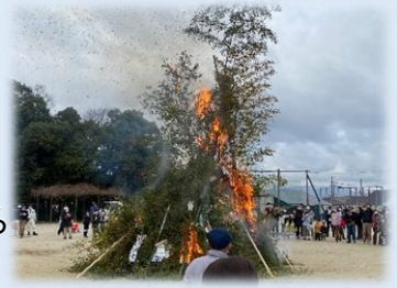
左義長(久世校区社会福祉協議会)

・介護問題や障がい者の社会参加、子育ての悩みなどの諸課題を、その家族や個人の問題としてではなく、地域の問題として捉え、考えるつどいを開催しています。