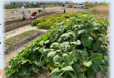
福祉農園(古川校区社会福祉協議会)

・地域でちょっとした困りごとを抱えている人を地域の住民同士で助けあえるよう取り組んでいます。