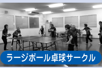
ラージボール卓球サークル