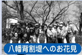
八幡背割堤へのお花見