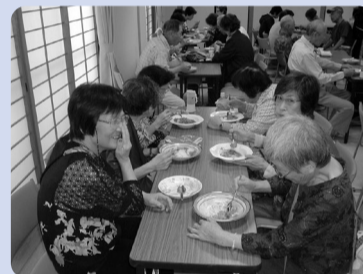
●「交通安全学習会とお食事会」