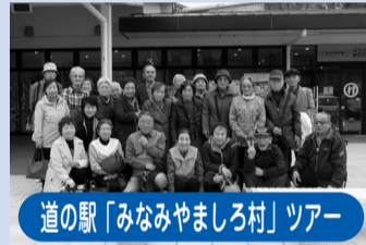
道の駅「みなみやましろ村」ツアー