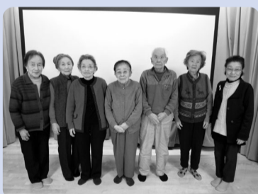
●座談会「自分史90年と陽和苑を語る」