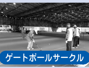
ゲートボールサークル