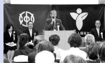
●創立30周年記念式典