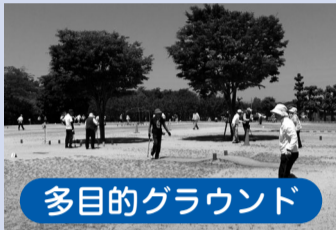
多目的グラウンド