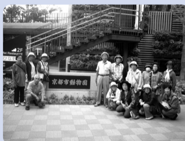
●苑外レクリエーション