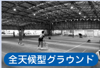
全天候型グラウンド