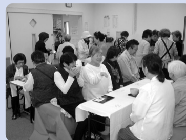
●「陽和苑」まつりでのお茶席