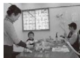
キッズコーナーのようす