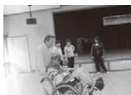
杉の子会の車いす介助体験