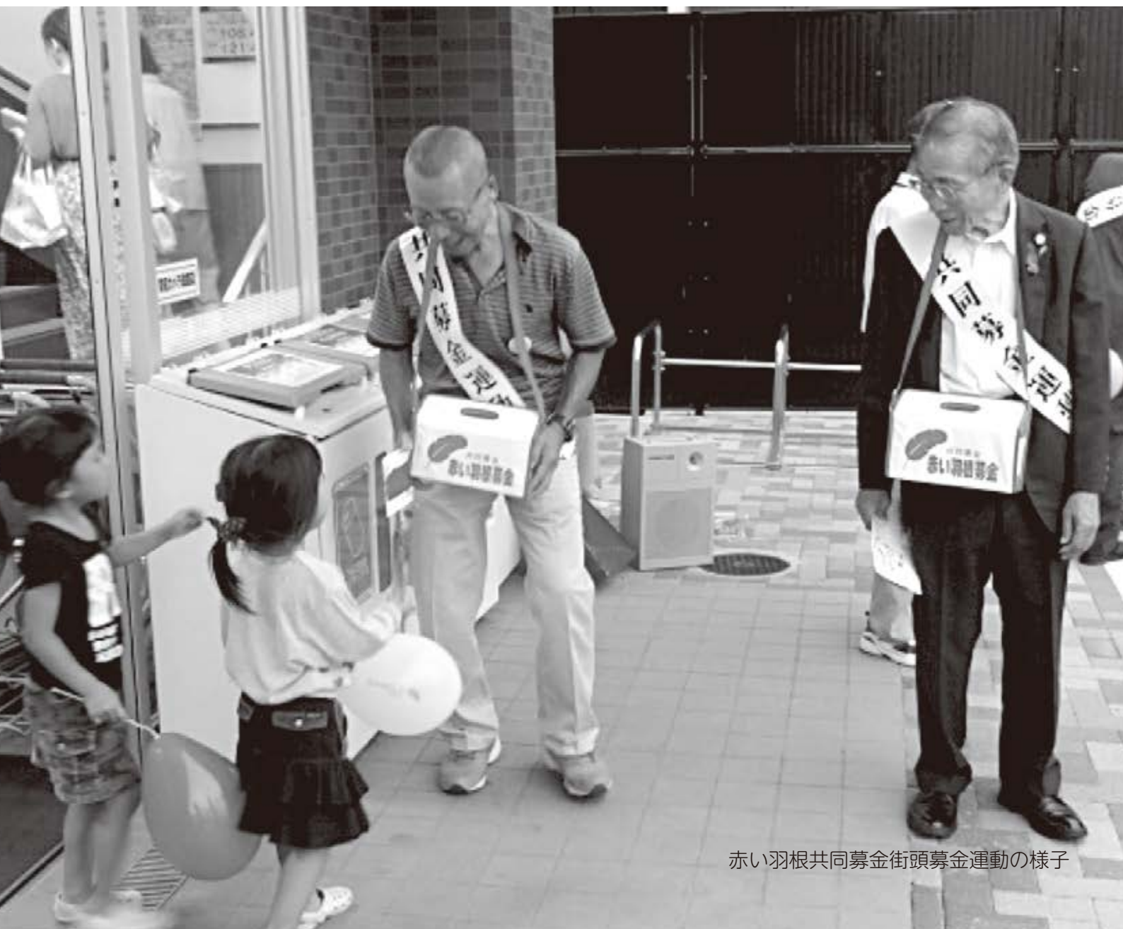
赤い羽根共同募金街頭募金運動の様子

戸別募金では自治会役員の方々のご協力により、全市的に取り組んでいます。どちらの募金も城陽市の地域福祉推進に使われます。被災地への義援金の募金にも取り組んでいます(詳細6ページ)。みなさまのご協力よろしく申し上げます。