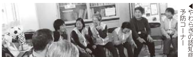
やわらぎの認知症予防コーナー