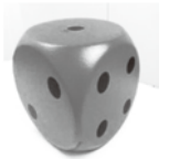
ジャンボサイコロ