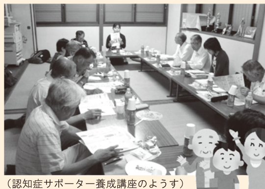
(認知症サポーター養成講座のようす)

【地域包括支援センター】 住所：寺田水度坂 130 番地 鴻の巣会館 電話：54-7330、55-3047