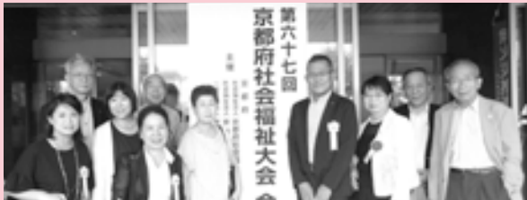
受賞者および参加者