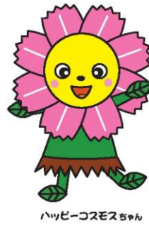
ハッピーコスモスちゃん