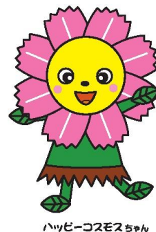
ハッピーコスモスちゃん

市民のみなさんと一緒に、サロンなどの集いの場や地域に必要な助け合い活動づくりを進める専門職です。気軽にご相談下さい