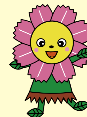
ハッピーコスモスちゃん