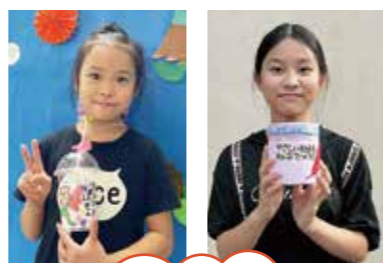
赤い羽根手作り募金箱を作ってくれました