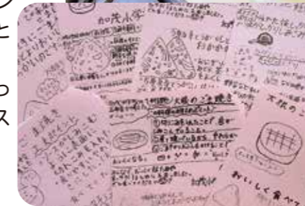
小学生考案のメニューチラシ