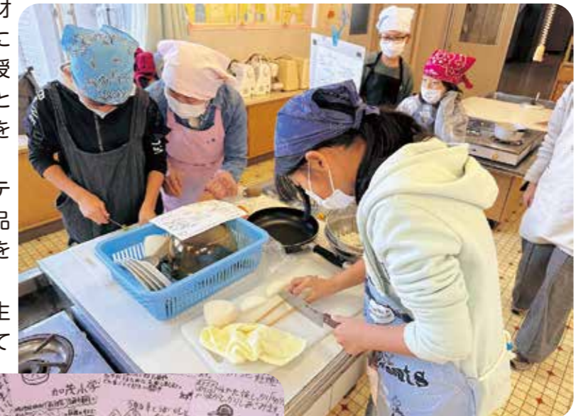
小学生とボランティアさんが調理

小学生が考えてくれたメニューの入ったお弁当は、チラシと共に配食サービス利用者さんへ届けられます。