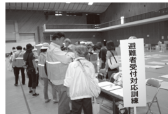
避難者受付係として役員も参加

中央体育館内で行われた「避難所開設訓練」では、避難してこられた方々の受付対応訓練と中学生への配膳訓練に協力しました。また、自衛隊や警察、消防の、日頃なかなか見ることのできない様々な訓練を見せていただいたことは役職員にとって非常に有意義なものであり、これから起こるかもしれない大規模災害に備え貴重な時間を過ごしました。