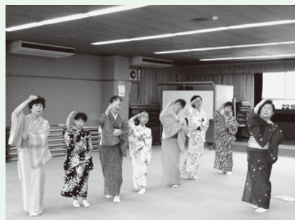
「ゆう舞の会」での様子