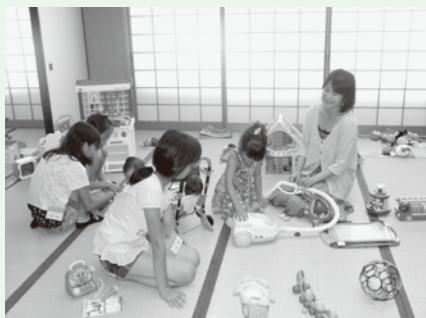
「山城おもちゃの図書館」での様子