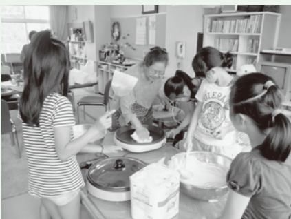
「サロンサポーターズ」での様子

小学校4年生から中学校3年生までの81名の参加者が、25のボランティアグループの協力を得て、夏休み期間中のボランティア体験学習を終えることが出来ました。