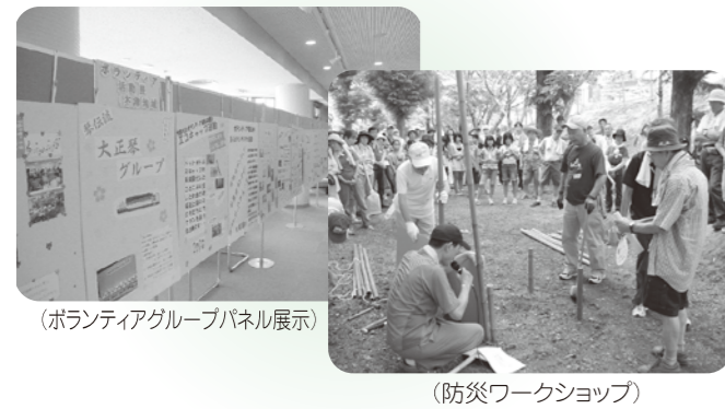
(ボランティアグループパネル展示)

同じ課題を持つ者同士の交流や課題改善や組織の立ち上げを支援しています (障がい児・者の交流会・介護者交流会など)