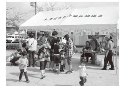
各支所でふれあいひろばを実施

「ふれあいいきいきサロン」は高齢者、障がい者、子育て世帯などが気軽に集える場として地域の役員やボランティアの協力により市内各地で開催頂き、25年度はサロンの数も参加者も増えました。「ふれあいひろば」は、支所ごとに支所運営委員、支部長が中心となって、民生児童委員やボランティアに協力を求め、企画運営をし開催することが出来ました。「防災ワークショップ」は支部の事業として、災害時に助け合える関係づくりに取り組みました。