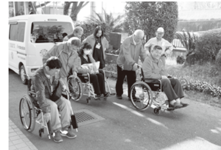
協力会員研修会の様子

他に代わるものの無い、地域を支える事業として、ますます利用が増え、在宅の高齢者や障がい者の方々に喜んでいただきました。公共交通機関を利用することが難しい方が、病院や公共機関へ行く手段を公的サービスで提供できないことの問題点を市へ訴え続けつつ、サービスをより良いものにしていきます。