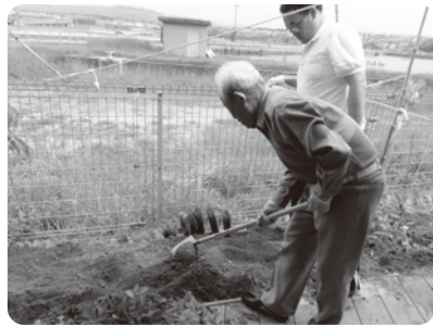
ハッピーコスモス農園

土おこしから肥料、種まき、草むしりなどのお世話をしていただき、りっぱな野菜が収穫できました。