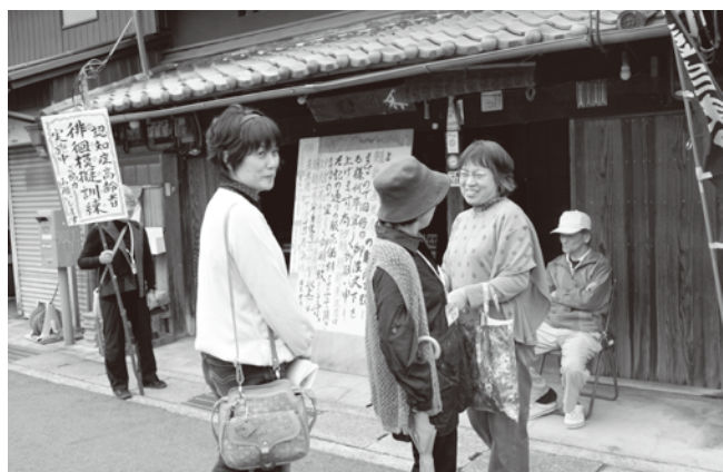
各支所で徘徊模擬訓練を実施

認知症について市民が知識を持つことで、高齢者が行方不明になることを未然に防ぐ取り組みとして、「徘徊模擬訓練」を行いました。地域包括支援センターと共に、民生児童委員等の協力を得て取り組んだことで、広く深きめの細かい取り組みとなり、認知症になっても安心して暮らせるまちづくりの一つとして関係者から高い評価を得ました。