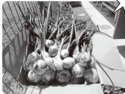
畑で収穫した玉ねぎでかき揚げを作りました。