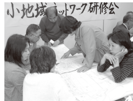
マップを囲み白熱する参加者

ワークショップでは、17支部に分かれ、『地域の支え合いマップ』づくりに懸命に取り組まれました。参加者からは異口同音に「情報把握・共有の重要性が再確認できた」の感想が聞かれました。