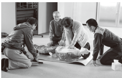
2回の役職員研修を実施 (AEDを使用した研修の様子)

25年度は、台風18号により、木津川市においても被害が発生する状況になりました。幸い大きな被害にならずに済みましたが、いざという時にご近所の方を助けることができるかということが、いよいよ現実味を帯びて目の前に突き付けられた経験となりました。その体験を共有することで、役職員が自覚を高め、自分の身を守ることに、家族の安全を確保すること、ご近所で助け合うことを考える機会となりました。