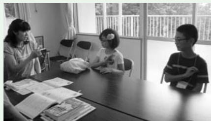
手話サークル「かたつむり」の体験の様子