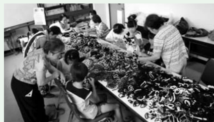
手芸サークル「すみれ」の様子