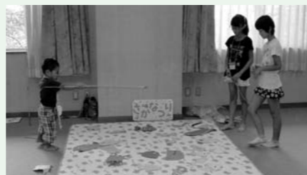
子育てサロンりんごちゃん・みるくちゃんの様子

小学校4年生から中学校3年生までの65名の参加者が、21のボランティアグループの協力を得て、夏休み期間中のボランティア体験学習を終えることが出来ました。