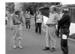
(木津 市坂地域での様子)

参加者からは「またこんな講座をしてほしい」「これからは声掛けできるかな」との感想が聞かれました。