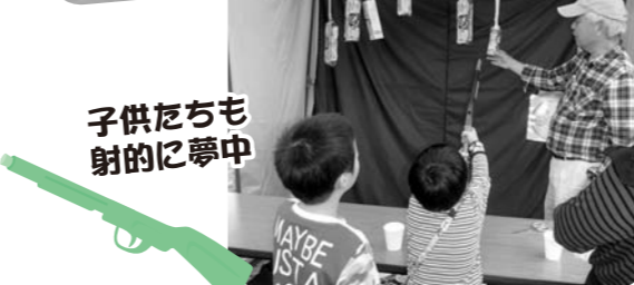
子供たちも 射的に夢中