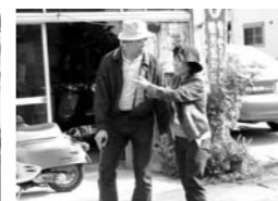
(山城 上狛地域での様子)

11月10日・11日の両日、いずみホールにて木津東部・西部民協と共催で励ます会を開催し、東部54名、西部52名の参加がありました。