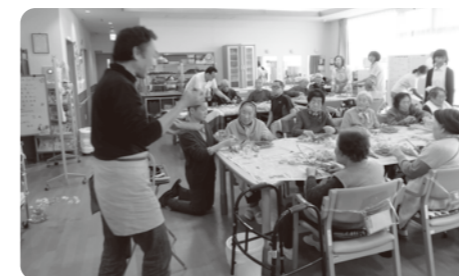
ひなまつりにちなんだフラワーアレンジメント。春らしい作品が出来上がり、優しい講師の指導で、男女問わず楽しまれています。した(*_*)