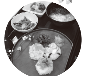
ひなまつりのてまりずし