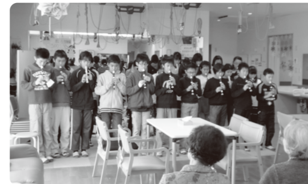
小学生から素敵な演奏のプレゼント