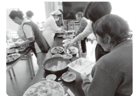
食事は事業所内で作り、出来立てを提供しています。特に、バイキングは美味しい楽しいと評判です。