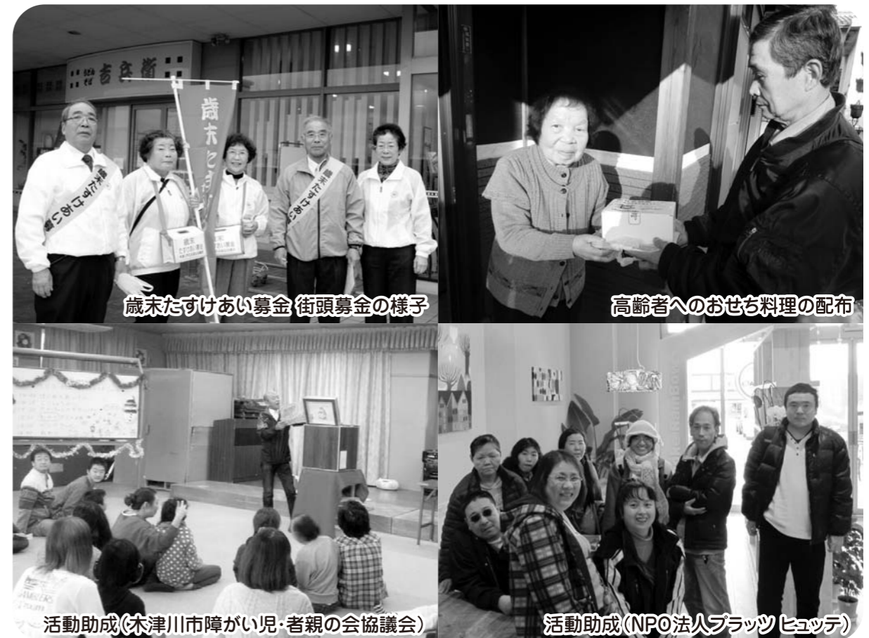
歳末たすけあい募金 街頭募金の様子