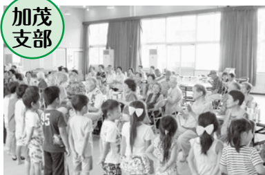
園児と笑顔で交流しました

加茂支部は、7月14日(木)、57名の参加で開催しました。ボランティアさんによ るギターとハーモニカの演奏に聞き惚れ、演奏に合わせて合唱し、また加茂ぬく もりの里の職員さんによる健康体操や頭の体操で、堅くなった体と頭をほぐしま した。