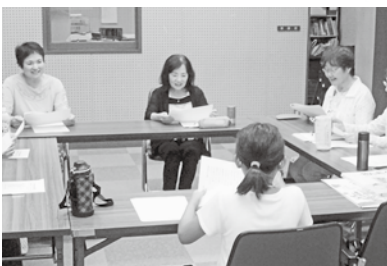
朗読「こだま」の様子