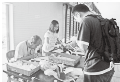
らららもかの様子