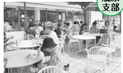
快晴の下で頂く昼食は格別でした

一部の歌劇は織田信長をテーマにしていることからとても見やすく、二部の ショーはこれぞ宝塚!トップスターを中心に繰り広げられる歌・ダンス、きらびやか な衣装は圧巻で、「昔よく行っていた宝塚に来られ、やっぱりいいものだなと実感 した」との声もあがり、あっという間に時間がすぎました。