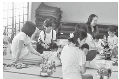
おもちゃの図書館の様子

小学校4年生から中学校3年生までの77名の参加者が、22のボランティアグループの協力を得て、夏休み期間中のボランティア体験学習を終えることが出来ました。