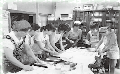
食育をとおしての居場所づくり