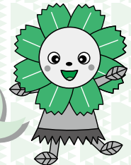
ハッピーコスモスちゃん