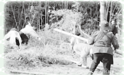
仲間とともに環境美化