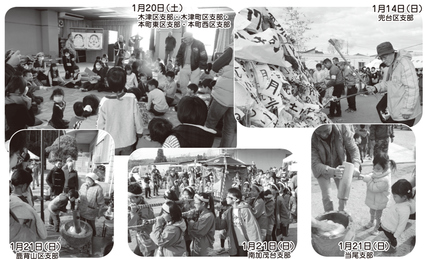
1月20日(土) 木津区支部・木津町区支部・ 本町東区支部・本町西区支部