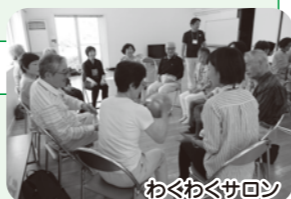
わくわくサロン “かぶとだに”