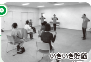
いきいき貯筋 カフェ