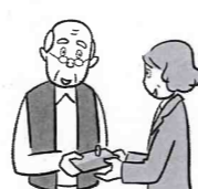
通帳やはんこの 管理が心配な方