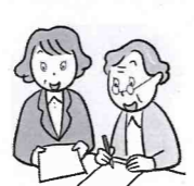
支払で困ったり 心配な方

活動に関心のある方はお問い合わせください 木津川市社協 (☎0774-71-9559)