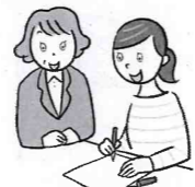
福祉サービスの 利用で困っている方