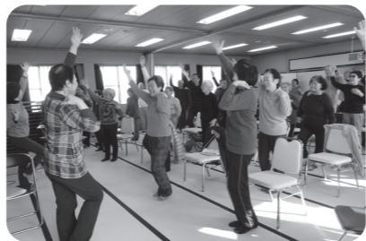
安心して暮らせる地域づくりの第一歩! ぜひお気軽にご参加ください!!

地域の方が元気アップ体操サポーター養成講座を受講し、体操指導の準備OK。民生委員、老人クラブ、地域長、社協支部が協力して運営しています。気持ちよく体を動かした後は、茶話会でおしゃべり。第1回目は40名以上の参加とボランティアグループのバンド演奏もあり、とても楽しい時間になりました。参加者からは「また来ます!」「次が楽しみ!」と嬉しい声が上がっていました。「元気」「健康」「交流」「笑顔」になれるサロンです。