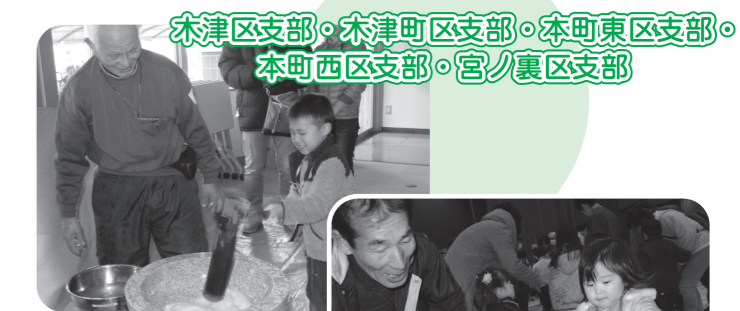
2月10日 お餅つきや 昔あそび