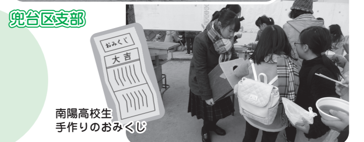
南陽高校生 手作りのおみくじ