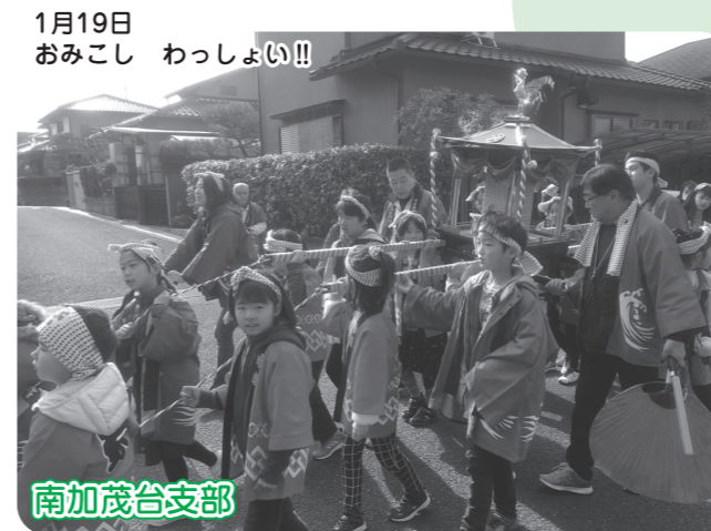
1月19日 おみこし わっしょい!!!