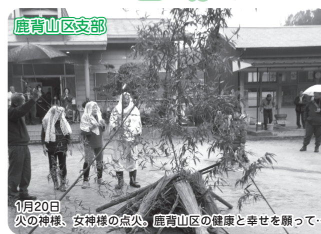
1月20日 火の神様、女神様の点火。鹿背山区の健康と幸せを願って...