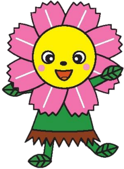
ハッピーコスモスちゃん