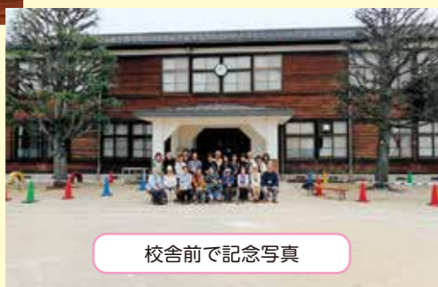
校舎前で記念写真