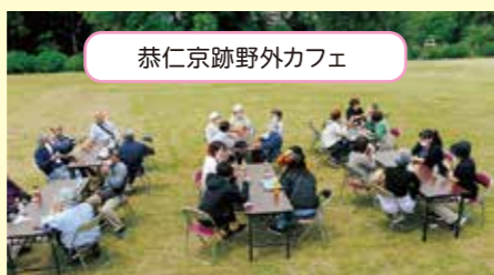
恭仁京跡野外カフェ