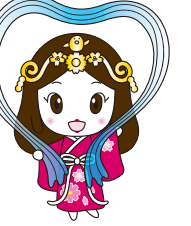
木津川市マスコットキャラクター いづみ姫

10月14日(土)アスピアやましろを会場に、きづがわ福祉フェスティバルを開催することができました。「第9回木津川市福祉大会」「福祉ふれあいまつり」「ボランティアフェスティバル」を一体的に開催。総勢400名を超えるスタッフの力を結集して、市民のみなさんが笑顔で過ごしていただくまつりになりました。ご参加いただきました皆様、ありがとうございました。