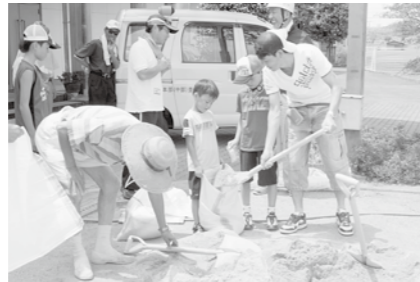
木津町区支部・土嚢作りに取り組みました