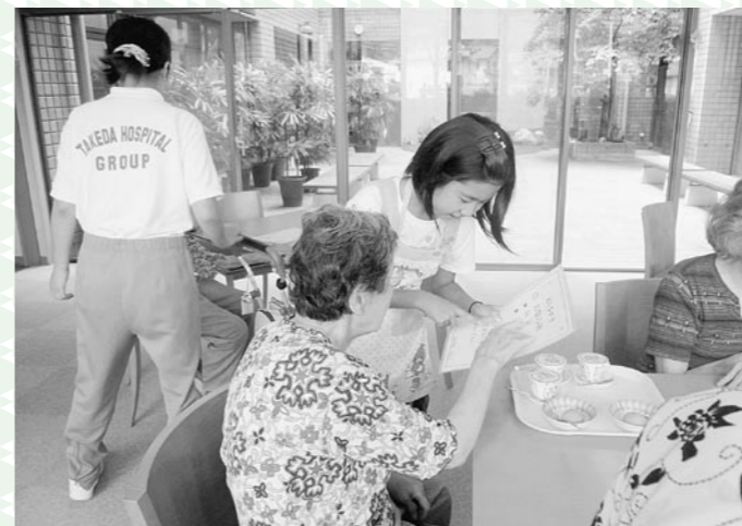
喫茶ボランティア体験(加茂の里)