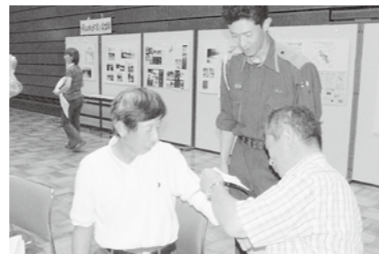
山城支所・三角巾を使った包帯法