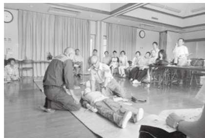
相楽台支部・AED救急講習