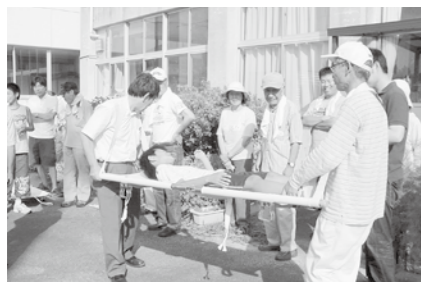
南加茂台支部・担架で搬送訓練!