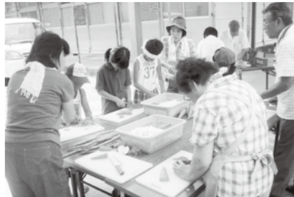
加茂支部・炊き出し

社会福祉協議会では、夏休み期間に、小学校区や行政区などで防災ワークショップを行っています。東日本大震災があった本年は、例年以上に多くの地域住民が参加しました。“防災”を通して“地域のつながり”がより強固になりました。