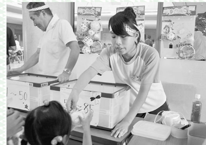
地域福祉体験(きづがわっこ夏祭り)