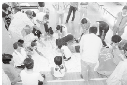
瓶原支部・防災マップ作り