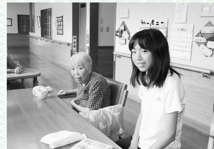
介護体験(ぬくもりの里)

今年度も夏休み期間中に、小学生・中学生・高校生、120名が福祉体験を行いました。小学生は地域のボランティア活動を体験し、中学生・高校生は普段なかなかふれあうことのない高齢の方々や小さな子どもたちとともに過ごして、たくさんを感じ、学びました。