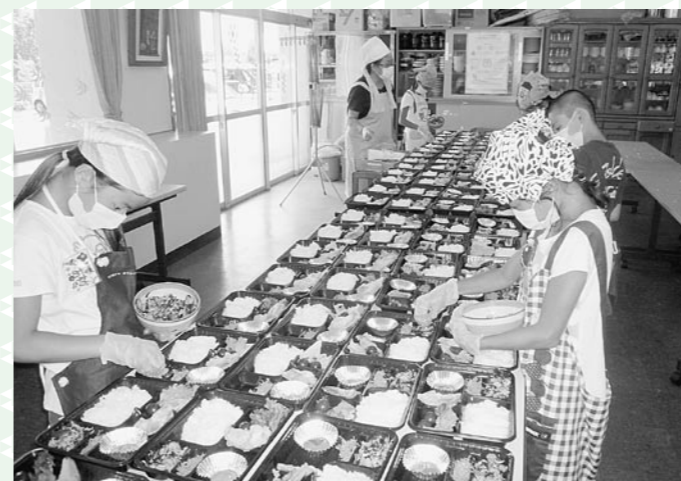
配食ボランティア体験(加茂ふれあいセンター)