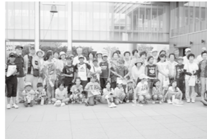
下川原区支部・神戸人と未来防災センター見学