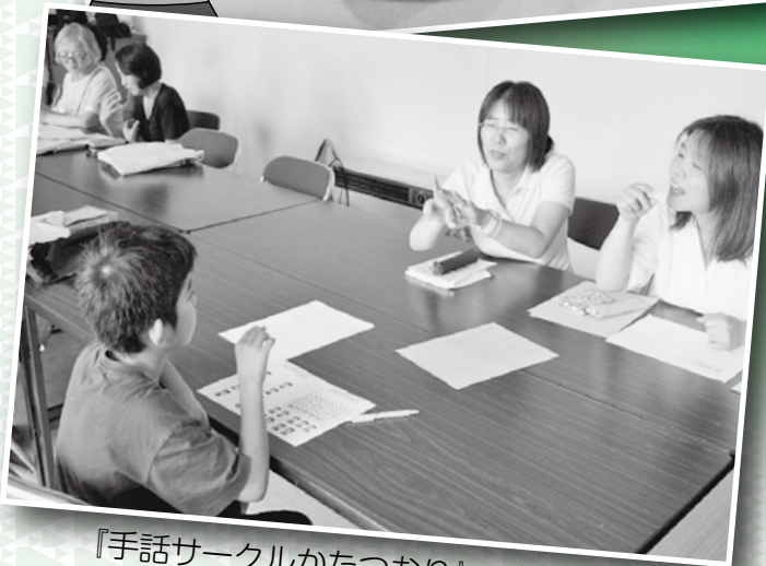
『手話サークルかたつむり』の様子

小学校4年から中学校3年までの64名の参加者が、26のボランティアグループの協力を得て、夏休み期間中のボランティア体験学習を終えることが出来ました。