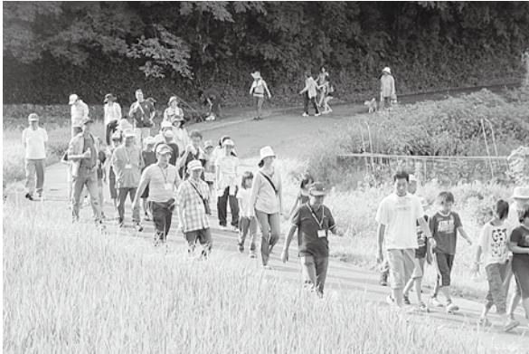
おはようウォーキング

翌朝の「おはようウォーキング」では、40名の小学生が参加。出会った住民に元気良くあいさつする姿が見られ、この催しによって“地域のつながり”がまた一步積み上げられたように感じました。