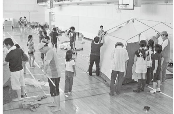
テントの組み立て