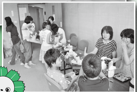
『おもちゃの図書館』の様子