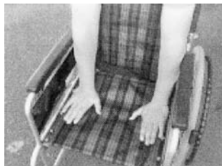
手をはさまないように注意する。