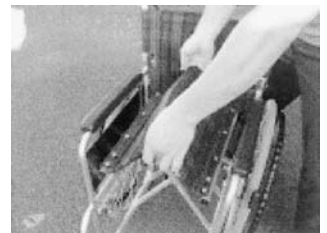
プレーキをかけシートの真ん中を持ち上げ折りたたむ。