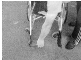
フットレスト(足置き)を上げる。