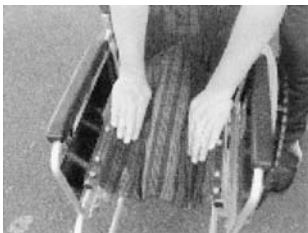
いすのフレームを押しながら広げる。