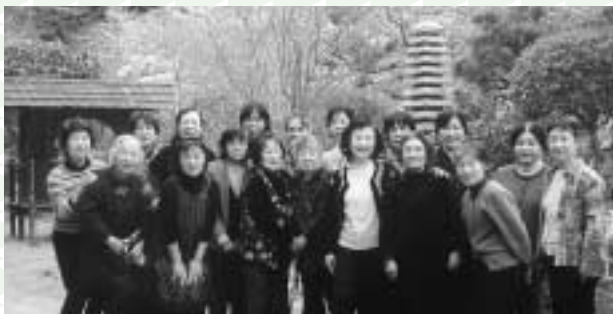
▲難聴者の方と一緒に花見に出かけました