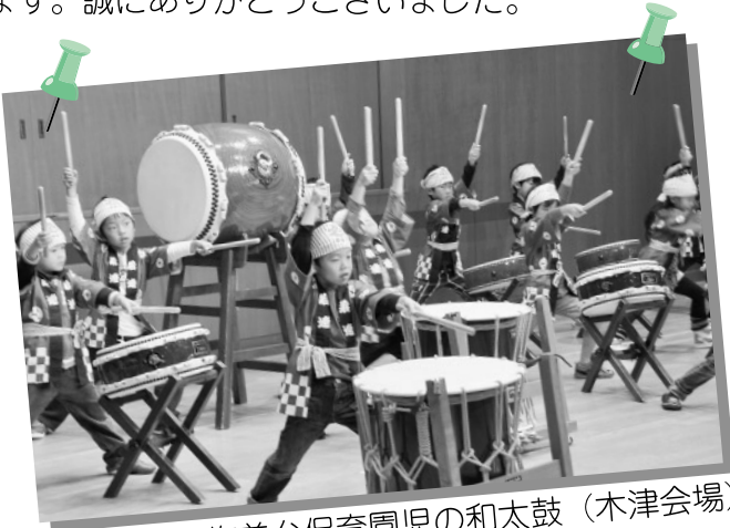
梅美台保育園児の和太鼓 (木津会場)

木津会場では、保育園児から小学生・中学生・ボランティアなどの世代を越えた舞台発表があり大いに盛り上がりました。加茂会場の青空野菜市では、夏の猛暑の影響が懸念されましたが、市民の皆様のご協力で、新鮮野菜がズラリと勢揃い。売り上げは、福祉活動の貴重な財源として活用させていただきます。誠にありがとうございました。