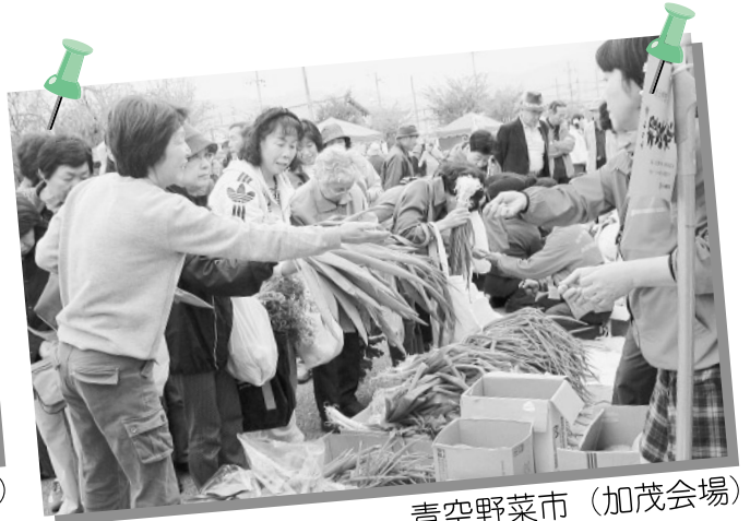
青空野菜市 (加茂会場)