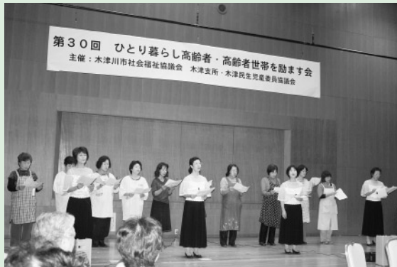
第30回 ひとり暮らし高齢者・高齢者世帯を励ます会 主催：木津川市社会福祉協議会 木津支所・木津民生児童委員協議会

秋晴れの中、2日間で135名の方々にご参加いただき手作りの食事に、コーラス、ビンゴゲームやチャンバラショーなどを楽しみ交流を深めました。