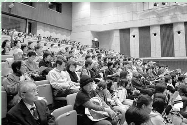
▲会場いっぱいの参加者