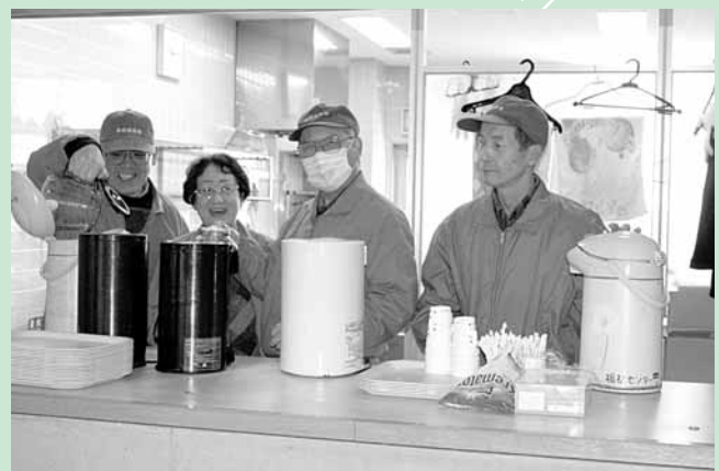
▲ボランティアのコーヒー喫茶

合併後初となる第1回木津川市福祉大会が2月28日（土）アスピアやましろで、開催されました。当日は天候にも恵まれ、510名の参加をいただきました。式典では、福祉事業功労者25名、ボランティア功労者28団体、福祉事業協力者5名、花と市民の写真コンテスト入選者10名が表彰を受けられました。