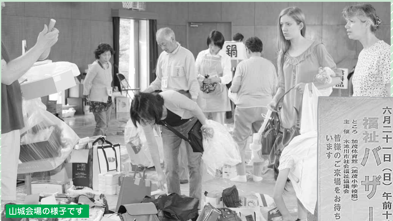
山城会場の様子です

六月二十一日(日) 午前十時～ 福祉バザー ところ 加茂体育館(加茂小学校隣) 主催 木津川市社会福祉協議会 皆様のご来場をお待ちしています