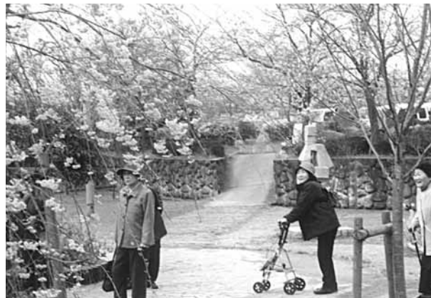
4月4日(水) 木津町区支部サロン