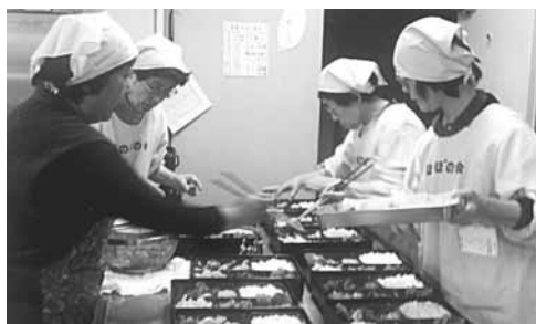
心を込めて弁当作り