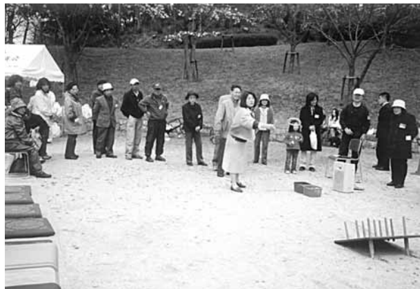
4月3日(火) 相楽台区支部サロン

この日は趣向を変えてお花見会。肌寒い一日でしたが、満開の桜に一同満面の笑みが溢れました。このあと室内に移りこの日のサロンも盛り上がりました。