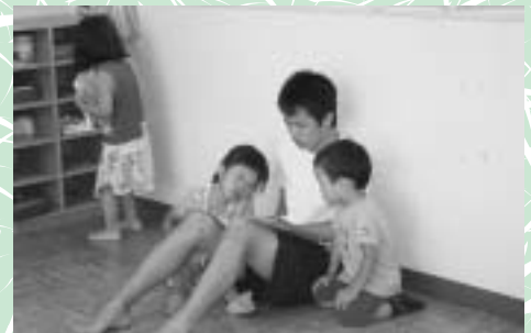
保育園での施設体験（絵本の読みきかせ）