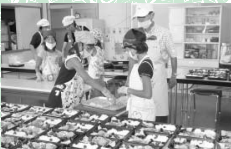
116食のお元気弁当の調理ボランティア体験