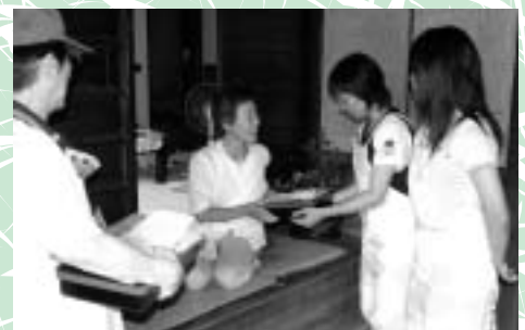
作ったお弁当を利用者へお届けしました