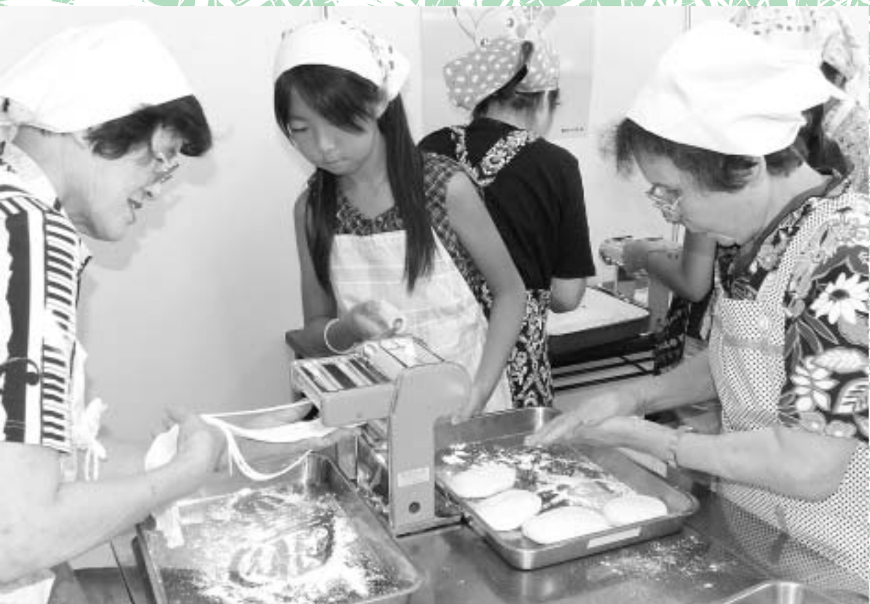
元気デイサービスの体験（うどん作り）