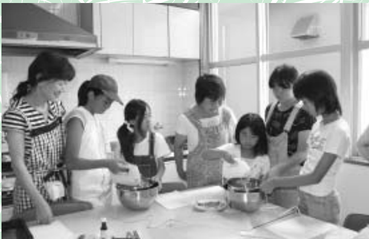
喫茶ボランティアのお菓子作り