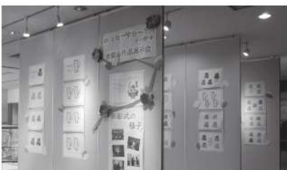
お元気ですか八ガキ表彰&作品展示会

そんな中、“集まらなくてもつながれる”新たな活動の検討を職員が自主的に進め、サロン参加者との往復はがきのやり取りやインターネットを活用した研修会や会議の実施など、新たな活動手段を手に入れることができました。