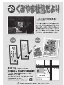
くみやま社協だより