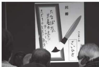
オンラインでの研修会の開催