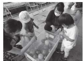
親子ニコニコ子育てサロン

母子父子児童委員会では、未就学のお子さんのいる家庭を対象としたサロン活動、ひとり親家庭を対象とした交流会を行っております。サロン活動は、子育て支援グループさくらんぼと協働で毎月「親子ニコニコ子育てサロン」、夏に実施いたします「親子ミニまつり」を行っております。ひとり親家庭対象の行事は11月に「ひとり親家庭親子交流会」を予定しております。対象となるご家庭で、母子父子児童委員会の行事に関心のある方は、社会福祉協議会までお問い合わせください。