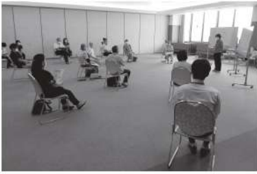
ささえあいのまちづくり会議

そんな中、本会はこれまでと同様に住民がもつ個別の生活課題に柔軟に対応するため、今だからこそ実施すべき事業や活動を住民と共に考え、安心できる地域生活にむけた取り組みにできる限り努めてきました。