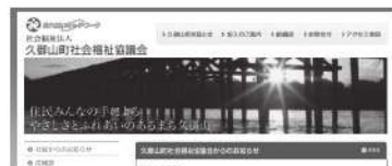
社協ホームページトップ画面

企画広報委員会では、久御山町社協の地域福祉活動や介護に関する情報を発信しています。皆さまが今読んでおられるこの「くみやま社協だより」も企画広報委員会で企画から発行するに至るまでを実施し、他にもホームページなどを通じて住民へ向けて発信しています。また隔年度で社会福祉大会の開催を企画しています。