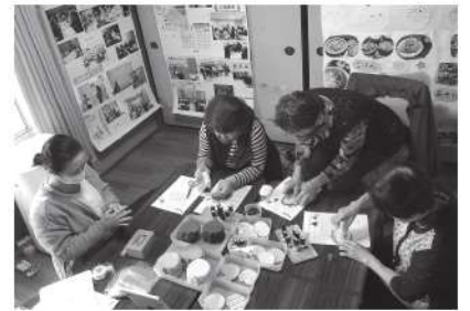
手作り&音楽マルシェ

居宅介護支援事業は、介護支援専門員を増員したことで、プランの作成件数が大幅に増加することとなりましたが、今後は人件費と収益のバランスについて他事業と同様に検討しなければなりません。