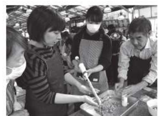
ひとり親家庭児童親子交流会 (令和元年度)