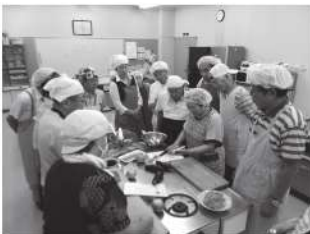
おとこひとりの料理教室