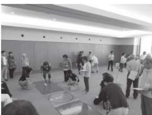
高齢者世帯交流会