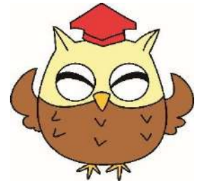
見守りネット キャラクター 福祉の「ふくちゃん」