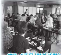
栄3・4丁目〈野外活動〉