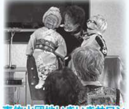
東佐山団地いきいきサロン