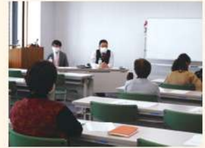
終い支度セミナーの様子