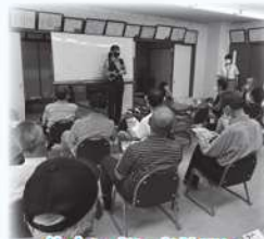
佐古いきいきサロン