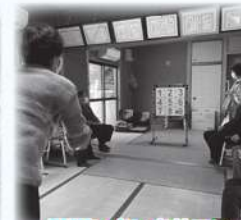
双栗いきいきサロン