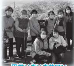
田井いきいきサロン