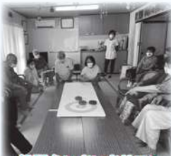
松陽台いきいきサロン