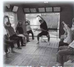
西武西林いきいきサロン