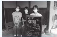
遊びにきてくださいね～