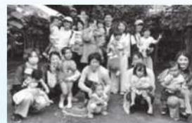
9月小山葡萄園にて(八幡市)